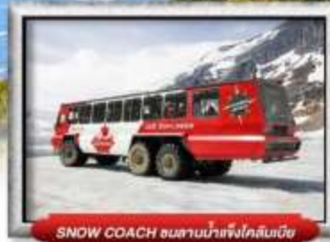
SNOW COACH ขนานน้ำแข็งใกล้หิมะ