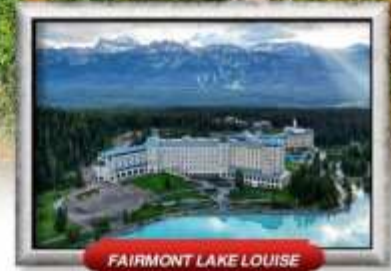
FAIRMONT LAKE LOUISE

บินทรู สายการบิน Full Service | เมนูพิเศษ! แคนาดาเคียนลิออนสแควร์