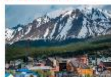
เมืองเอลคาลาฟาเต

** พักที่ Xelena Hotel 4* หรือเทียบเท่า **