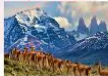
อุทยานแห่งชาติตอร์เรส เดล เพน