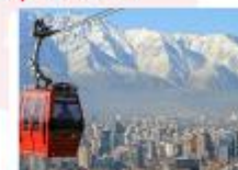
นั่งกระเช้าขึ้นสู่เนินเขาซานต้า ลูเซีย