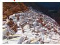
เหมืองเกลือโบราณ