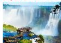
จุดชมวิว Devil's Throat