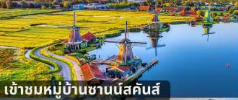
เข้าชมหมู่บ้านชานีส์คันส์