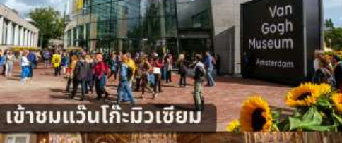
เข้าชมแวนโก๊ะมิวเซียม