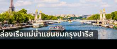
ล่องเรือแม่น้ำแซนชมกรุงปารีส