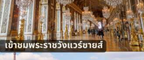
เข้าชมพระราชวังแวร์ซายส์