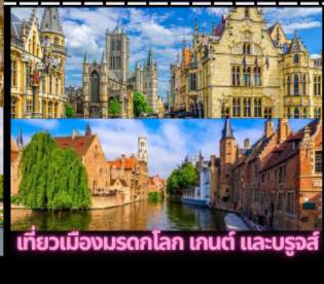
เที่ยวเมืองมรดกโลก เกนต์ และบรูจส์