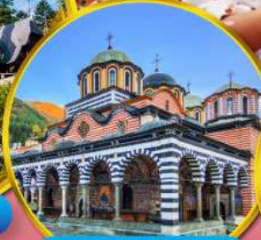
อารามมรดกโลกริลา

บุกดินแดนแห่งรัตติกาล ชมเทศกาลกุหลาบ 1 ปี มีเพียงครั้ง สัมผัสวิถีชีวิตชนพื้นเมือง เยือนเส้นทางมรดกโลก