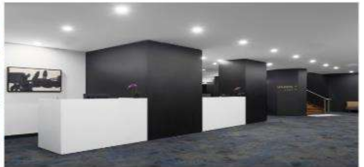
(โรงแรมย่านกลางเมือง ใกล้แหล่งช้อปปิ้ง เดินทางสะดวก) *รูปภาพเพื่อการโฆษณา*