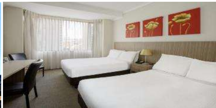
(โรงแรมย่านกลางเมือง ใกล้แหล่งช้อปปิ้ง เดินทางสะดวก)