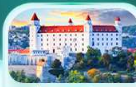
ปราสาทปราตีสลวา

เที่ยวชมเมืองอัลสส์ดัทท์ หมู่บ้านรักทะเลสาบสวยที่สุดในโลก พระราชวังเซินบรุนน์ เมืองลินซ์ จิตรกรรมฝาผนังยักษ์ สัมผัสเมืองมรดกโลก เซสท์ ครุมลอฟ เยี่ยมชมปราสาทปราก ถนนทองคำ เช็กอินสถานที่ชื่อดัง! ปราสาทปราตีสลวา ล่องเรือชมความงามแม่น้ำดานูบ แม่น้ำที่ยาวที่สุดในยุโรป ชมความน่าหลงใหลของ ปราสาทบูคาเปสต์ สะพานชาร์ลส์