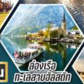
ล่องเรือ ทะเลสาบอัลสติก