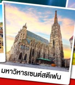
มหาวิหารเซนต์สตีเฟน