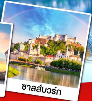
ซาลส์บวร์ก