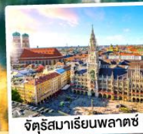
จัตุรัสมาเรียนพลาตซ์